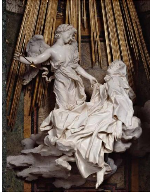
Resim4: Bernini, Azize Terasa, 1644-52

iktidar arasında gidip gelen varlık sorunu farklı idare şekli adı altında devam ede gelse de asıl olan ortak yaşamın iç düzeninin nasıl bir sürece evrileceğidir. İnsanlık tarihi bunu Ortaçağ skolastik düşüncenin giderek yozlaşmış çürümesiyle Bertrand Russell’ın deyimiyle kendini içten patlatması ve ardından gelen Rönesans ve Aydınlanma hareketiyle sağladı. Toplumlarının kendi içinden çıkardıkları iktidar organı, Thomas Hobbes’e göre bu bir “zorunlu bir araya gelme” durumudur. Bu ortaklığın neticesinde; insanların zorla ya da dolaylı haklarını devrettiği devlet aygıtı ve onda vücut bulan kamu birliğinin sunmuş olduğu çözüm yöntemidir. J.J. Rousseau’a göre; “toplum sözleşmesi” olarak insan aklının iradesidir. Öyle bir ortaklık şekli bulunsun ki, ortaklardan her birinin şahsını ve mal ve mülkünü müşterek kuvvetin olanca şiddetiyle korusun ve bu ortaklık sayesinde, her ortak, hem herkesle birleşsin, hem de yalnızca kendi kendisine itaat etsin ve yine eskisi kadar özgür olsun. (Roussa,2014,s.41)Yönetim şekline bakılmaksızın toplumları bir arada tutan temel bileşenlerin; inanç temelinde veya kimlik üzerinden aidiyet duygusunda hatta çıkar birliğinde ya da esaret altında tutulan bir kuvvet bileşeninde olsun kendi anıtsal çalışmalarını üretebilmişlerdir.Resim4: