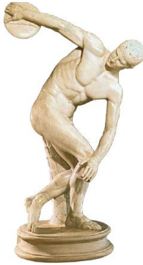
Resim3- Yunan sanatı, Myron disk atan heykel İÖ. 460-450

Tanrıyla güç birliği içinde olan iktidarların, temsil ettiği tebaa arasında geçen süreci konu alan sanat çalışmaları, üslup ve estetik açıdan hayatın organik yanını değil, soyut bir dünyanın algısını bizlere sunar. Wilhelm Worringer'in Soyutlama ve Özdeşleşim konulu doktora çalışmasında vurguladığı gibi; Mısır ve eski Yunan kültürü arasındaki farkı inorganik ve organik sanat olarak tanımlar. Mısırdaki bir bezemeye konu olan bitki motifi soyuttur, aksine eski Yunan'da ise seçilen bitki gerçektir ve doğada bir karşılığı vardır. O nedenle ki Mısır heykel sanatı, metafizik bir algılamayı ön plana çıkaran soyutlamalar üzerine kurulurken, çok tanrılı bir inanca sahip ve kendi yönetim idaresini seçen, yasayla yönetilen eski Yunan kültürü ise, modelin doğasını öne çıkartan klasik bir sanat anlayışında çalışmalar üretir. Sonuçta Mısır sanatında kutsiyeti içinde barındıran anatomik yorumlamalarda sanki tanrının cisimleşmiş organik kütlesi anlatılır, ancak eski Yunan heykellerinde ise tanrı yeryüzüne inmeye başlar ve bir insan bedeninde modelin en mükemmel cisimleşmiş halini yansıtır. Resim3:(Germain,2015,s.86)