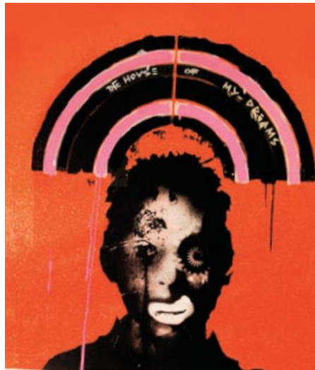
Resim7: Banksy'nın bir grafiti çalışması

Kamusal alan aynı zamanda bir sergileme ve etkinlik alanıdır, sadece anıtsal olana değil ulusal ya da uluslararası veya bireysel sanatçıların çalışmalarına planlanan sürede kısa sergileme olanağı sağlar, teknik, malzeme ve anlayış farklılığı ve sınırlama olmadan, sanatçının kendini özgürce ifade edebildiği alanlar olarak kabul edilir. Kamusal alanlar bu yönüyle Grafiti gibi davetsiz sanat çalışmalarına da kendini ifade etme şansı tanır; açık hava meydanları ya da kapalı kamusal alanlar birer resim tuvaline döner. Daha çok sokak sanatı olarak adlandırılan ve kıymet derecesi entelektüel sanat çevresinden ziyade toplum katında merak uyandıran başka bir sergileme metodudur ve kamusal sanat etkinliğinde bir diğer kategori olarak karşımıza çıkar. Resim7