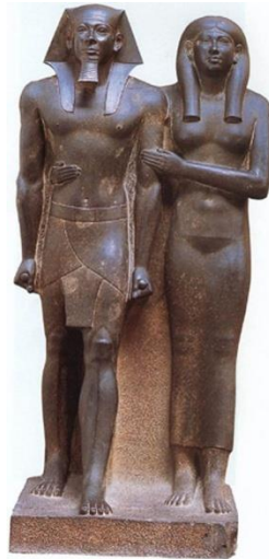
Resim2- Mısır sanatı, Mikerinos Eski Krallık, 4. Sülale MÖ. 2500

Heykel, kült toplumlarında görülenin aksine köleci toplum iktidarında sınıfsal bir karakter çizer, temsil yetkisi yönetici sınıfın eline geçmiştir. Ortak yaşam ritüeli, güç karşısında ekonomik artı değer yaratmak üzere bir araya getirilen köle ve yönetici sınıf arasında, itaat kültürü üzerine inşa edilir. İktidarın tanrısal gücü, mimari yapılara ve diğer sanat çalışmalarına anıtsallık olarak yansıtılır, bu kazanımlar yoğun emek gücün oluşturduğu artı değer sayesinde. Metafizik bir dünya algısıyla şekillenen köleci toplumların birbirine yakın ortak kaderleri yönetici sınıfın kaderine bağlıdır. Yönetici iktidarla tanrısallığın aynı şey olduğu fikri üzerine inşa edilen sanat çalışmaları, modelin doğasını dışlamayan, yarı soyut üslup içinde metafizik bir anlayışta ele alınır. İnsan ve hayvan heykellerinin en belirgin özellikleri soyutlamaya dayalı, minimal ve geometrik kesinlik arz eden anıtsallık kavramında biçimlenmiş olmalarıdır. Resim2:(Germain,2015,s.90) Sembol, şekil, bezeme ve işaretlerin plastik bir değer yaratma endişesinden ziyade, metafizik bir etkiyi tamamlamak için gerekli olanı, tanrısallık kavramında yükselmeyi amaç edinen bir ideali resmeder.