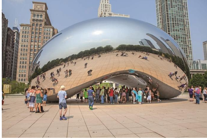
Resim6: AnisKapoor, CloudGate, 2006

kavramında cisimleşir, kamuoyunun onayını almasıyla bulunduğu mekanın tapusunu alır ve böylelikle “kamusal eser” statüsü hakkı kazanır. Resim6