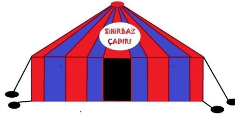
Tablo 2. Küçük Sihirbazlık Çadırı

Sihirbaz çadırları bazen büyük şehirlerde varlığını sürdürüyordu. Ankara Sıhhiye'de akşamın karanlığı hissedilmeye başladığında elinde gazeteler olan bir çocuk son haber, son haber diye akşam gazetesi satarken insanlar eğlenmek maksadıyla Ankara Gençlik Parkı'na giderlerdi. Gençlik Parkı'nda akşam çok canlı olurdu. Özellikle lunapark ve lunaparkın içerisinde yer alan oyuncaklar, çekiliş stantları, üstüvane ve sihirbaz çadırı büyük ilgi görürdü. Gençlik Parkı içerisinde yer alan sihirbaz çadırı, Mersin'de kurulan çadırdan biraz daha küçüktü. Lunapark içerisindeki sihirbaz çadırı küçük ve yuvarlak şekildeydi. Çadırın içerisinde gösteri standı yer alırdı ve seyirciler sahneye dönük bir şekilde ahşap sandalyelere oturlardı.