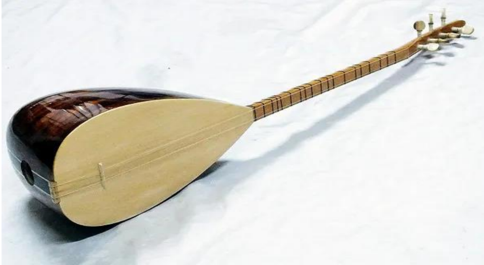
Şekil 1. Bağlama

“Sapın uç kısmındaki kırma adı verilen kısımda yuvalarına yerleştirilmiş, tel uçlarının sarılı bulunduğu “burgu” adı verilen veya eski adıyla “kulak” denen parçalar yer alır. Burgular kendi etrafında çevrilmek suretiyle bir ucu alt eşiğe bağlı olan tellerin gerginliğini belirlemede kullanılır. Bağlamanın akordu burgular sıkılarak veya gevşetilerek yapılır. Burgu yapımında, yuvayı aşındırmayacak ve kendi sertliğini koruyacak, gözenekleri az olan şimşir, abanoz, pelesenk, gül ve gürgen gibi ağaçlar tercih edilir.” (Karaçay, 2020).