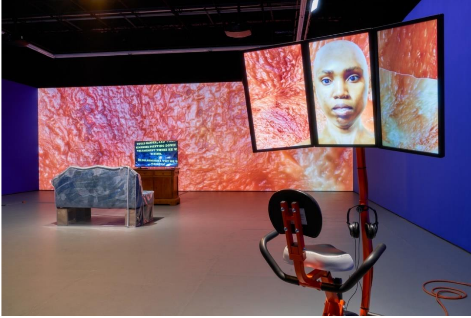
Şekil 2. Sondra Perry, Graft and Ash for a Three Monitor Workstation (Üç Monitörlü Bir Çalışma İstasyonu için Greft ve Kül), 2016