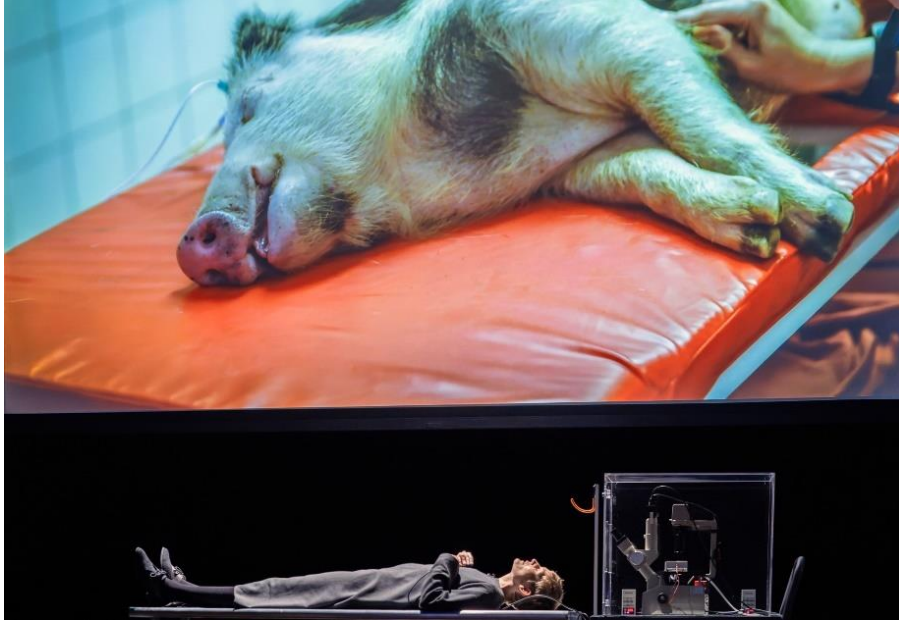
Şekil 4. Deather Dewey-Hagborg, Xeno in Vivo, 2024