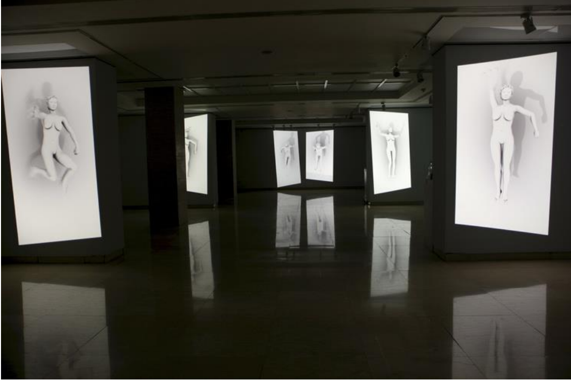
Şekil 1. Claudia Hart, Body On Screen (Ekrandaki Beden), 2013

bağlamda, Body on Screen , toplumsal normlara ve bedenin geleneksel algısına meydan okuyan, siberfeminist perspektifle üretilmiş bir üretim olarak dikkat çekmektedir.