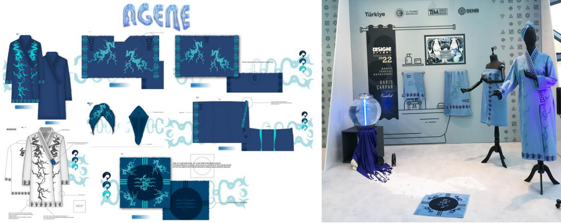
Görsel 2: Barış Çarpar, Banyo kategorisi ikincisi "Agene" adlı çalışma.

çalışmaları yapıp dikimleri gerçekleştirilmiştir. Bornozun omuz detayı, kemeri ve peştemalin bağlamak için kullanılan kenar bağı el işçiliği ile örülerek yapılmıştır.