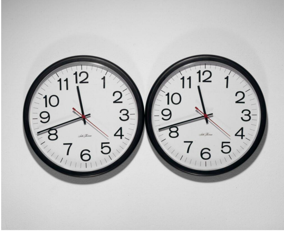
Resim 8. Felix Gonzalez-Torres, “Başlıksız” (Mükemmel Âşıklar), 1991, New York Modern Sanat Müzesi (Graf, 2021).

edilmiştir” (Graf, 2021). Eserlerinde kendi içsel duygularını ifade etmeyi amaçlayan sanatçı çoğunlukla birden fazla parçadan oluşan kompozisyonlar yaratmayı tercih etmiştir. González-Torres, kayıp ve hafıza temalı çalışmalarıyla AIDS’in etkilerini ve bu salgının insanların yaşamındaki izlerini görsel olarak dile getirmiştir.