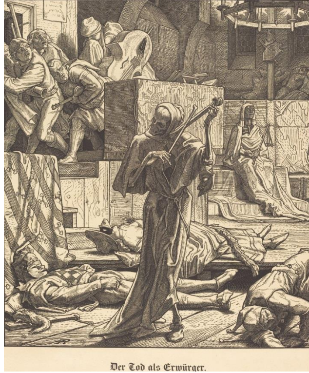
Resim 4: Alfred Rethel, Ölüm boğazlayan: Paris 1831’de bir maskeli baloda koleranın ilk salgını, Gravür Baskı, 31.0 x 27.6 cm, Baillieu Library Print Collection (Stone, 211, 36).

Veba, eski çağlardan günümüze kadar uzanan ve insanlık tarihine damga vuran salgın hastalıklardan bir diğeridir. 1346 yılından itibaren Avrupa’da görülen veba salgını, aslında 1330’lu yıllarda Asya’da ortaya çıkmış ve zamanla farklı bölgelere yayılmıştır. Salgının yayılmasında ticaret yolları ve ulaşım ağları önemli bir rol oynamıştır. 1346-1350 yılları arasında dünya genelinde birçok ülkeye yayılan bu salgın, büyük ölçüde ticaret yoluyla bulaşmıştır. Orhan Kılıç’ın Mikrop, Salgın ve Toplum adlı kitabında, 1348-1351 yılları arasında yaşanan ve “Kara Ölüm” olarak adlandırılan bu salgının Avrupa nüfusunun %31’ini, yani yaklaşık 23.840.000 kişinin hayatını kaybetmesine neden olduğu belirtilmiştir (Kılıç 2021: 70). Tarih boyunca vebanın birçok çeşidi sanat tasvirlerine yansıtılmıştır. Arnold Böcklin, 19. yüzyılın sonlarına doğru Avrupa sanatında önemli bir figür olan İsviçreli bir ressamdır. Böcklin, doğa, ölüm, salgın, mitoloji ve insan ruhunun derinlikleri gibi temalarla çalışmış ve eserlerinde sıklıkla mistik, distopik ve karanlık öğeler kullanmıştır.