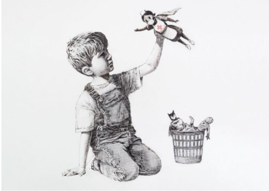
Resim 9. Banksy, Southampton General'in C Katı , Birleşik Krallık, 2020

Kaynak: https://www.theguardian.com/artanddesign/2020/may/06/banksy-artwork-superhero-nurse-nhs-coronavirus-covid-19-southampton-general-hospital , 21.11.2024