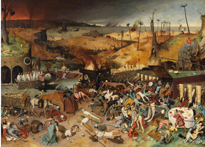
Resim 1. Yaşlı Pieter Bruegel, Ölümün Zaferi ( The Triumph of Death ), 1562, Panel Üzerine Yağlıboya, 117x162 cm, Prado Müzesi, Madrid.

Ortaçağ Avrupa'sına bakıldığında ise büyük yıkımların, travmaların ve ölümlerin yoğun olduğu bir dönem göze çarpmaktadır. İtalyan edebiyatının ünlü ismi Giovanni Boccaccio'nun The Decameron 'u 3 Kara Veba salgını sırasında insanların sığındığı kırsal bir bölgeyi anlatmıştır. Yazar bu dönemin salgın hastalığını ve bu hastalıklardan yansıyan felaketin toplumsal etkilerini hikâyelerinde işlemiştir. Diğer yandan resim sanatındaki en iyi örneklerden biri de Pieter Bruegel the Elder'in The Triumph of Death ( Ölümün Zaferi ) isimli eseridir. Sanatçı veba ve diğer hastalıkların toplum üzerindeki yıkıcı etkisi ile kaos anını resmederek salgının sanat tarihinde nasıl yer aldığına ilişkin iyi bir örnek sunmuştur. Pieter Bruegel'in Ölümün Zaferi adlı eserinde kıtlıktan insanoğlunun kemiklerinin sayıldığı kalabalık bir kompozisyon oluşturulmuş, görselde tam bir kaos ve acı alegorisi hali gözler önüne serilmiştir.