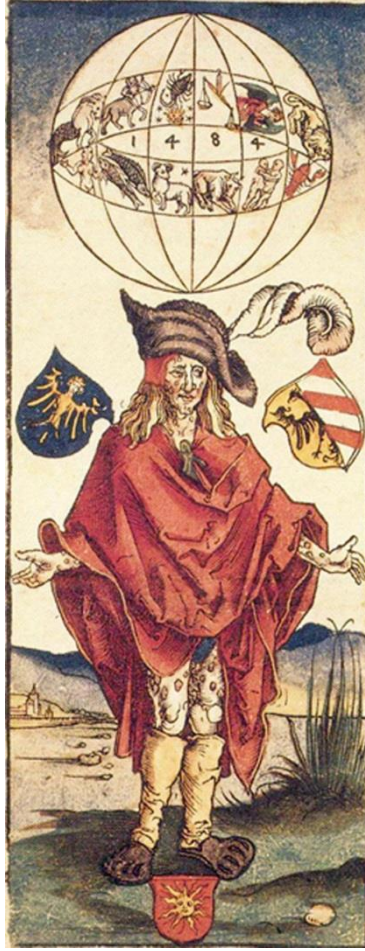
Resim 2. Albrecht Dürer, Syphilitic Man (Frengili Adam) , 1496, Renkli Ahşap Baskı, 25.7 x 9.7cm