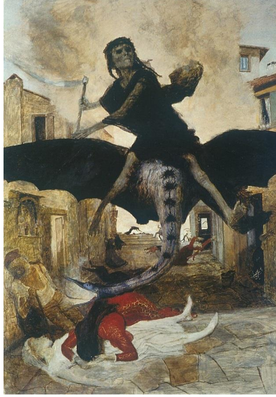
Resim 5. Arnold Böcklin, Veba , 1898, Kunstmuseum Basel.