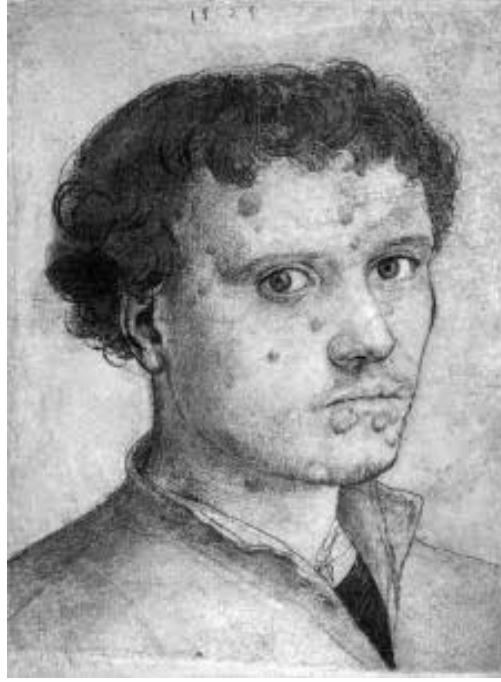
Resim 3. Genç Hans Holbein. Ulrich von Hutten'in Portresi, 1523, 20,5 x 12,2 cm, Harvard Sanat Müzeleri, (Valenti, 2017).

Veba, cüzzam, sıtma ve frengi gibi salgın hastalıklarla insanlık, oldukça erken dönemlerde tanışmış ve 19. yüzyılda kolera da bu hastalıklar arasına katılmıştır. “19. yüzyılın en ölümcül hastalığı olarak kabul edilen kolera, ‘vibrio cholerae’ adlı bakterinin sebep olduğu bir bağırsak enfeksiyonu olarak kabul edilmektedir. 1817’de Hint Okyanusu civarında ve Asya’da görülen hastalık daha sonra tüm dünyaya yayılmıştır” (Tekin 2021: 336). Kolera, insan vücudunu zayıflatan ve kişinin ölümüne sebep olabilen bir hastalıktır. Hijyen ile ilgili sorunlar hastalığın daha hızlı bir şekilde yayılmasına sebep olmaktadır. Özellikle Avrupa’da kolera salgınları, sanatçılar tarafından toplumsal bir eleştiri ve insanlığın ölümle olan ilişkisini sorgulayan bir tema olarak benimsenmiştir. Kolera konusunu ele alan en önemli eserlerden biri Alman bir sanatçı olan Alfred Rethel’in yapmış olduğu Der Tod als Erwürger (Ölüm boğazlayan: Paris 1831’de bir