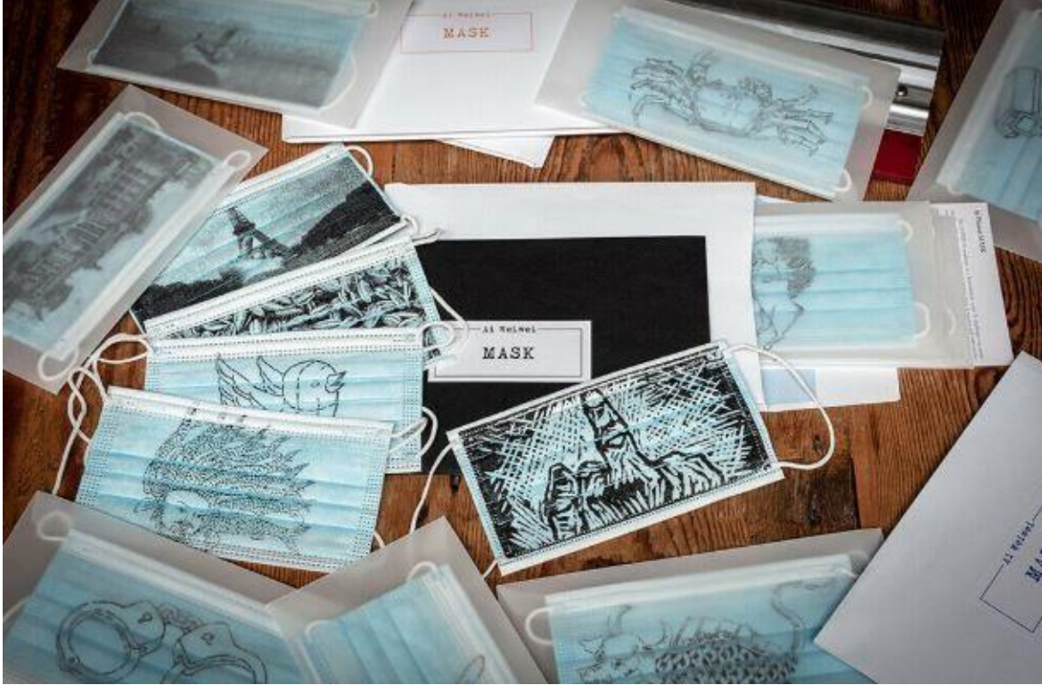
Resim 12. Ai Weiwei, MASK, Serigrafi, 2020