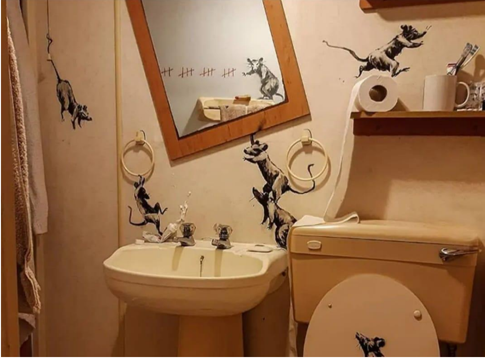
Resim 10. Banksy, Kendini tecrit ederken Banksy'nin banyosundaki duvar resimleri. 2020.