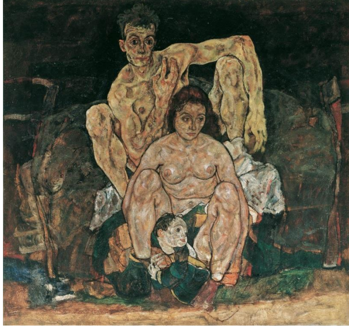
Resim 6. Egon Leo Adolf Ludwig Schiele, Aile, 1918.