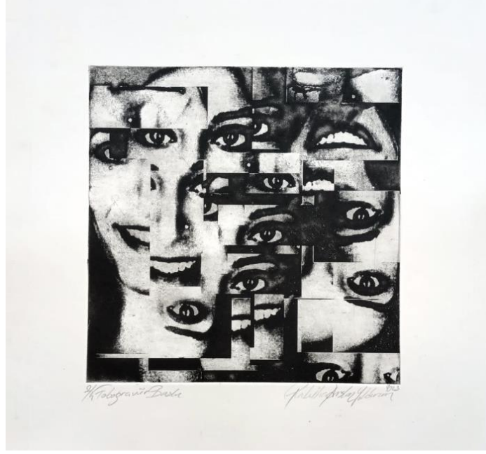
Şekil 1. Rabiha Arslan Yıldırım, İsimsiz , Fotogravür Baskı, 29,5x29,5 cm, 2023.

Baskiresimlerde, yapıbozuma/yapısöküme uğratarak yeniden inşa edilen portrelerin; anlam olarak çoğullaşması ve biçim yönünden deforme edilmesi, parçalanması ile anlam, biçim ve ifade yönünden yapısöküm yaklaşımı görülmektedir. Kare formunda kalıplar oluşturularak baskısı alınan çalışmalar ile erkek egemen toplum içerisinde kadın ve kimliğinin sınırlamasına eleştirel bir yaklaşım sergilenmektedir. Bu sınırlar içerisinde parçalanan kadının yer yer soyutlanması, siyah renkle kadının içerisinde olduğu çaresizliğinin vurgulanması, yanı sıra siyahın ölümü, karamsarlığı çağrıştırmaları, beyaz rengin ise özgürlüğü temsil etmesi açısından etkileyicidir (Şekil 2).