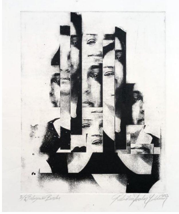
Şekil 3. Rabiha Arslan Yıldırım, İsimsiz , Fotogravür Baskı, 19,6x24,5 cm, 2023.

Dikdörtgen form içerisinde, kadını simgeleyen üçgen form ile yapılan baskiresim çalışmasının, Derrida'nın metinlerinin sonsuz anlam içermesi ile benzerlik gösterdiğini söylemek mümkündür. Eserde anlam ve görünüm çoğullaştırılarak yapı sökümü uğratılmıştır (Şekil 3).