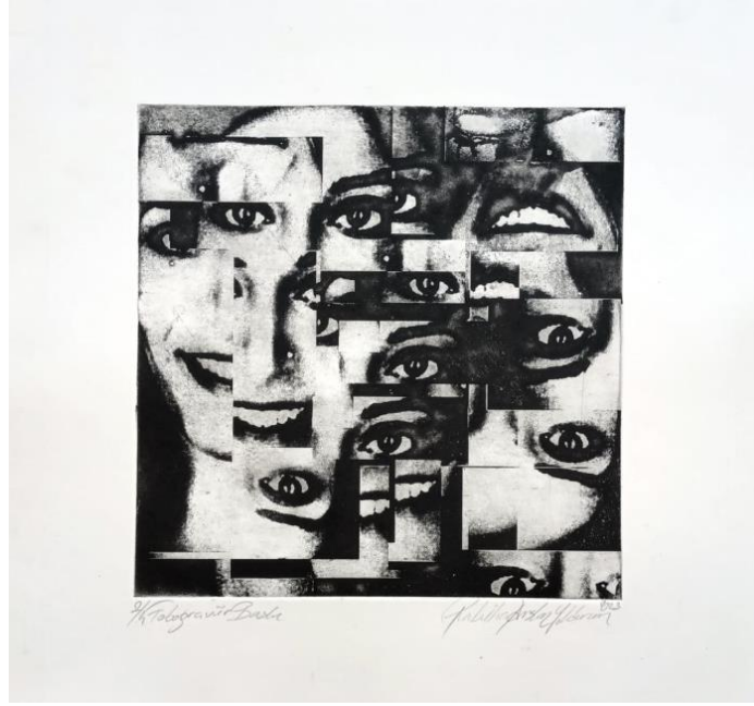
Şekil 1. Rabiha Arslan Yıldırım, İsimsiz , Fotogravür Baskı, 29,5x29,5 cm, 2023.

Baskiresimlerde, yapıbozuma/yapısöküme uğratarak yeniden inşa edilen portrelerin; anlam olarak çoğullaşması ve biçim yönünden deforme edilmesi, parçalanması ile anlam, biçim ve ifade yönünden yapısöküm yaklaşımı görülmektedir. Kare formunda kalıplar oluşturularak baskısı alınan çalışmalar ile erkek egemen toplum içerisinde kadın ve kimliğinin sınırlamasına eleştirel bir yaklaşım sergilenmektedir. Bu sınırlar içerisinde parçalanan kadının yer yer soyutlanması, siyah renkle kadının içerisinde olduğu çaresizliğinin vurgulanması, yanı sıra siyahın ölümü, karamsarlığı çağrıştırması, beyaz rengin ise özgürlüğü temsil etmesi açısından etkileyicidir (Şekil 2).