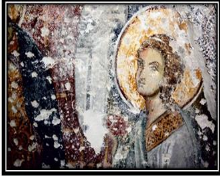
Görsel 1. Arap Camii'nde 1999 Depreminde Dökülen Sıvaların Altından Çıkan Freskolar.

Fatih Sultan Mehmet 29 Mayıs 1453 'te yedi tepe üzerine kurulmuş olan İstanbul'u fetih sonrası ilk olarak 30 Mayıs 1453'te Ayasofya'yı camiye dönüştürür. Fetih sonrası ibadethaneleri değiştirme geleneği burayı da etkiler. Bizans'tan kalma başkentte Osmanlı İmparatorluğu'nun da önemli yapılarının yükseldiği görülmektedir. Antik tarihe sahip İstanbul'un yapıları konumları itibarıyla araştırmalara konu olmuştur. Bu önemli yapılardan olan Topkapı Sarayı'nın Bizans akropolü üzerine kurulduğu bilinmektedir (Tezcan, 1989). İstanbul'un her yerine dağılmış vaziyette kiliseler görmek mümkündür. Fakat bugün birçok kilisenin cami olduğu da görülmektedir (Bora, 2013: 89-90). Gül Cami, Fethiye Cami, Fenari İsa Cami, Zeyrek Cami, Koca Mustafa Paşa Cami gibi sayılabilir (Çelik, 2016: 25). Bu yapılardan bir tanesi de Galata'da bulunan Arap Camii'dir. "Arap Camii" adını İspanya'dan göç eden Arapların Galata'ya yerleşmesinden sonra almıştır (Marmara, 2021: 13-16). Galata'da 14. Yüzyılda Cenevizlilerden kalma bir yapı olan Arap Camii'nin Dominikenler tarafından yapıldığı bilinmektedir. 1999'daki yaşanan depremden sonra kilisenin duvarlarındaki sıvalar dökülmüş ve Arap Camii'nde bulunan fresklerin erken dönem rönesans izleriyle karşılaşmıştır (Akyürek, 2011: 301-341; Palazzo, 2014).