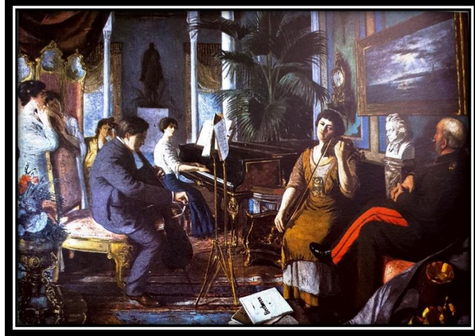
Görsel 3. Abdülmecid Efendi'ye Ait Harem'de Beethoven Adlı Yağlıboya Resmi