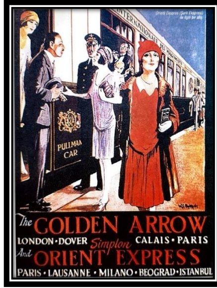
Görsel 4. Paris-İstanbul Arası Sefer Yapan Orient Ekspres'in Afişi (Dörtbudak, 2015: 365).

Pera'nın nüfusu kentin ana arteri diyeceğimiz Grande Rue de Pera ya da diğer adıyla Cadde-i Kebir 'de toplanmıştır (Çelik, 2016: 49). Pera'da sosyal yaşam alanları giderek artmaktadır. Giyim kuşamın, yaşam stiline, yapıların Türkiye'de farklı görünümün ve yaşamın ivme kazandığı yerdir (Cezar, 1991: 16).