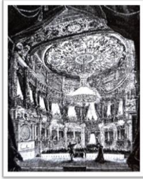
Görsel 5. Dolmabahçe Sarayı Tiyatrosu (Aracı, 2010: 269).

ve Pera'da yaklaşık on beş otel 19. yüzyılın ikinci yarısında açılmıştır. Bu dönem sadece ticaret için veya resmi görevle gelip konaklayanların dışında turist gruplarının da ilgi gösterdiği dönemdir. Bölgede oteller giderek önem kazanmıştır. Oteller salonlarında maskeli kıyafet baloları düzenlemektedir seçkin müşterilerini etkilemeye çalışmaktadırlar. Roma Oteli ve Paris'teki Büyük Louvre Oteli gibi lüks otel sahipleri Galata ve Pera'dan Avrupa otellerine müşteri çekmek için ilanlar verdikleri görülmektedir. Bunun da semtin Avrupa ile benzer müşteri kitlesine sahip olduğunu bize düşündürmektedir. Genellikle Tepebaşı'nda yer alan otellerin manzaraları Haliç manzarasıyla ön plandadır bunlardan biri de Pera Palas'tır. Bir diğeri ise Pera Caddesi'nde yer alan ünlü Tokatlıyan otelidir. Kent sakinlerinin yiyecek ve içecek tercihlerinin Batılılar gibi olduğu anlaşılmaktadır. Bu tarz yeme-içme mekân sahipleri Levantenlerden oluşmaktadır. Avrupa'daki gibi her türlü hamur işi, pasta, şekerleme, dondurma, reçel gibi çeşitli ürünleri Pera Caddesindeki pastanelerde bulmak mümkündür. Fransız bonbon şekerleri ve drajeleriyle Lebon, İngiliz pasta, reçel, draje, dondurma çeşitleriyle Baltzer ve Markiz gibi pastaneler ünlüleridir (Akın, 2011).