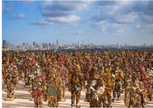
Şekil 8- Ha Schult, “Trash People”, 2002

Bir başka örnek “Bir gün hepimiz çöp olacağız, bugünün Coca-Cola şişesi yarının, şimdiki bakış açısına göre Roma döneminden kalmış arkeolojik buluntuymuşçasına gelecek neslin karşısına çıkacak” sözünü sarf ederek “sanatta geri dönüşüm” hareketini amacı uğruna yansıtmış olan sanatçı sanatçı Ha Schult şeklinde verilebilir (Hans Jürgen Schult)). Sanatçı teneke kutular, bilgisayar atıkları gibi çöp malzemelerle ürettiği, toplamda 1000 adet olan “Çöpten Figürler” “Trash People” adlı çalışması ile geri dönüşüm/sanat diyaloğunu, yaratmak istediği farkındalık duygusu ve çeşitli şekillerde biçimlendirdiği atık malzemelerle ilişkilendirerek kurmuştur (şekil 8-9). (Bkz.Lindner, Meissner, 2015).