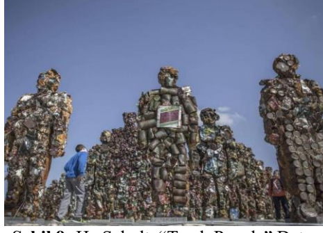
Şekil 9- Ha Schult, "Trash People" Detay

Günümüze daha yakın örneklerle devam etmek gerekirse MFTA 1 adlı ikinci malzemeler temin eden bir kuruluştan malzemelerini temin eden Juan Hinojosa'dan bahsedilebilir. Metro kartları, gıda ambalajları, kuru temizleme etiketleri, düzleştirilmiş kutular ve çeşitli alkolsüz içecek, alkol, ev eşyaları ve dondurulmuş gıdalar markalar gibi günlük hayatımızın nesnelere ile "Ready for Stones" adlı çalışmalarını ortaya koyan sanatçı geri dönüşüm kavramını kapsamında işler üretmiştir. Sanatçı tüketimi teşvik eden merkezi stratejileri yansıtarak, alıcıyı bir fantezi, arzu ve umut dünyasına sürüklediğini ve tüketimin yüzeyselliğini gözler önüne sererek bu konuda farkındalık uyandırmaya çalışarak geri dönüşüm kavramını direk amaç olarak canlandırmıştır (Lapin, 2015: Parag.9-10) (şekil 10-11).