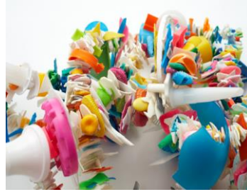
Şekil 7- Rox De Luca, Plastikler için Gleaning, Rose Bay Beach, 2020, Plastik, Tel

Günümüze yakın süreçte ise araç olan geri dönüşüm konusu artık amaç haline gelmeye başlamıştır. “Geri dönüşüm sanatı” ortaya çıkmış ve bu sanat çerçevesinde özellikle doğada yaşanan olumsuzluklara karşı farkındalık oluşturma yolunda çalışmalar ortaya çıkmıştır. Avustralyalı sanatçı Rox De Luca, Sidney sahillerinde atılarak biriken plastik parçalar olan şişeler, şişe kapakları, pipetlerle yaptığı heykelsi çelenkler şeklinde yaptığı çalışmalarla amaç haline gelmiş “geri dönüşüm” ilişkili eserlere örnek teşkil etmektedir(şekil7). Sanatçı insanların tüketim eylemlerine karşı farkındalık oluşturmak istemiş ve çelenklerini “Gleaning for plastics, defying wastefulness”, “israfa meydan okuyan plastikler için temizlik” olarak adlandırmıştır (Bkz.Rox De Luca, 2020).