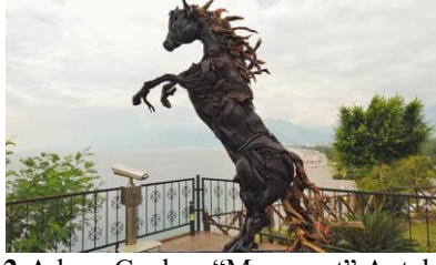
Şekil 12- Adnan Ceylan, “Manavgat” Antalya, 2021