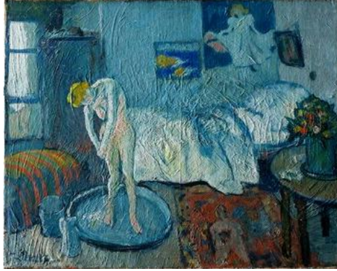
Şekil 1- Picasso, "Mavi Oda Tablosu"

Kaynak: https://heritagesciencejournal.springeropen.com/articles/10.1186/s40494-017-0126-5/figures/2 Erişim