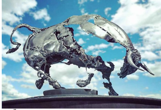
Şekil 13- Cem Özkan, “Boğa” Antalya, 2021, 30x45x35 cm, Metal

Yine Türk sanatçılardan Cem Özkan’ın atık hurda, metal, organik atık materyallerle ürettiği işleri (şekil 13), Taylan Türkmen’in inşaat demir atıklarıyla yaptığı heykeller (şekil 14) ile Ali Abayoğlu’nun şanzıman hurdaları, atık metal ve pencere camları kullanarak yaptığı heykelleri (şekil 15) birer geri dönüşüm kapsamında çalışmalarıdır (Mıhlayanlar Ezgi, 2021, parag.1-4)