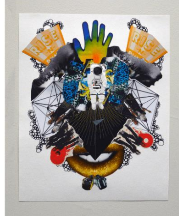
Şekil 11: Juan Hinojosa, Serbest Düşüş, 2015 Kolaj 21" x 17"