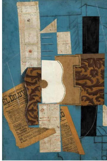
Şekil 6- Juan Gris, "Kompozisyon", Tuval Üzerine Yağlı Boya ve Atık Nesne, 1917

İspanyol Kübist Ressam Juan Gris'in, şekil 6'da yer alan yapılandırma kağıtları olan atık nesnelere yapmış olduğu çalışması, biçimsel arayışlarına cevap olmuştur. Bu çerçevede atık nesnelere renk, leke, dokusal özelliklerinden yararlanılmış, onların planlı bileşimleri ile oynayarak kendi kompozisyonlarını meydana getirmiştir (Şahin, 2022:1-22)