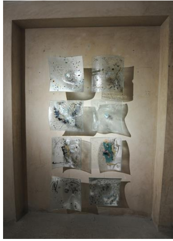
Şekil 15-Ali Abayoğlu, Cam, Endüstriyel Atık