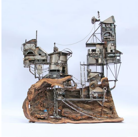
Şekil 14- Taylan Türkmen, İsimsiz

Şekil 68-69 Kaynak: https://www.galerisoyut.com.tr/ngg_tag/cem-ozkan/erişim tarihi: 20.09.2022