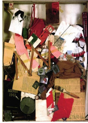
Şekil-3 Fernandez Arman, Jacques Mahe de la Villegle'nin Robot Portresi, 1963Kaynak: http://www.armanstudio.com/artworks/ Erişim tarihi: 17.02.2021

Kaynak: https://heritagesciencejournal.springeropen.com/articles/10.1186/s40494-017-0126-5/figures/2 Erişim Tarihi: 12.08.2021