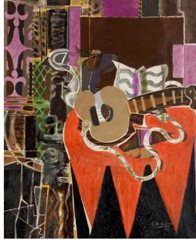
Şekil 4- Georges Braque, “Mandolin ve Skor”, Toz Kuvars ve Kum ile Kolaj ve Guaj Teknikleri, Basel Sanat Müzesi, İsviçre, 1941.

yoksunluğu sonucu oluşmakla birlikte, bu dönemdeki sanatçıların biçimsel anlatım ifadelerini geliştirmeleri sonucu da oluşmuştur. Bu anlatım ifadeleri bazen renk arayışı, bazen iki boyutun yetemediği durumlarda üçüncü boyutu ararken ortaya çıkmıştır. George Braque resimde üçüncü boyutu yaratmak için karmaşık dokular oluşturmaya çalışmış bunu da “Mandolin” (1938) (şekil 4) adlı çalışmasında tuvalin zeminine kolaj tekniği ile toz kuvars ve kum ekleyerek gerçekleştirmiştir (Bkz. Braque-Apollonio- Payró -Gijón,1965).