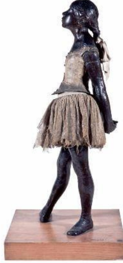
Şekil 5- Edgar Degas, The Little Fourteen-year-old Dancer (On dört Yaşındaki Küçük Dansçı Heykeli), (La Petite Danseuse de 14 ans), 1881