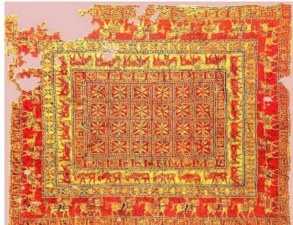
Resim 2: Pazırık Halısı, Grifon Figürü Detay Çizimi.