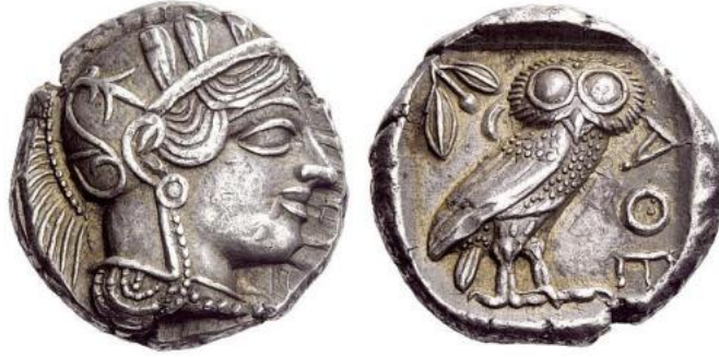
Resim 1: Athena ve Baykuş, Athena'nın gümüş tetradrahmisi üzerinde bir tasvir, MÖ 454-415 (Us, 2020).

Anadolu kültüründe ve farklı kültürlerde benzer değerlerin ortak sembolü olarak Turna kuşlarının coşku, hüznün gibi duyguların anlatımında sıklıkla kullanıldığı görülmektedir (Yalvaç, 2011). Urfa şehir merkezine 15 km uzaklıktaki Göbeklitepe'de, kazı ve araştırma projesi sonucu ortaya çıkarılan dikilitaşlar, hayvan motifleriyle bezenmiş sütunlar önemli bir veri olarak dikkat çekmektedir. Mitlerin yaşam bulduğu bölge olarak bilinen Göbeklitepe'deki dikilitaşların üzerlerindeki sembollerden insanların o dönem avcılık dışında başka uğraşlar içerisinde olduğu anlaşılmaktadır. Buradaki hayvan sembollerinin ve kabartmaların döneme ilişkin ipuçları taşıdığı düşünülmektedir. "Turna'nın kutsal sayılan kuşlardan biri olarak en bilinen niteliği haberci olması idi. Bunlar mevsimsel döngülerde oynadıkları rollerle insanın doğa ile kurduğu ilişkide kesin bir aracı rolü üstlenmişti. Gaipen taşınan haberler onların gezginlerin koruyucusu ya da ölü ruhların çobanı olarak anlam taşıdığı kazanmasına yol açmış olabilir (Halis, 2022, s. 25). Anadolu'da kuş motifli mezarlara bilhassa çift başlı kuşlara rastlanılmaktadır. Ruhun kuş tarafından taşınma olgusunun yaygın oluşundan yola çıkarak buradaki kullanım amacının da yine ruhu sembolize etmek olduğu düşünülmektedir. En nihayetinde kuş ile ilişkili imgelerden en bilindik olanları; ruh, ölüm, tanrı, uçmak, göksel ifadeleri şeklindedir.