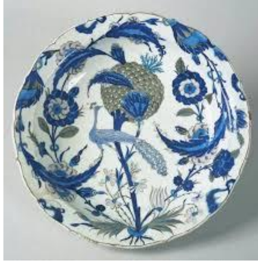
Resim 6: Şam İşi Çini Tabak, Louvre Müzesi, 16.Yüzyıl (Bilir, 2018, s. 57).

form ve desenlerine rastlanılmaktadır. Bu formlar arasında en çok da tavus kuşunun tasvir edildiği gözlemlenmiştir. Cennet kuşu olarak bilinen ve aynı zamanda Hindistan'ın ulusal kuşu olan Tavus kuşu, Yunan mitolojisinde Hera'nın çok sevdiği kutsal hayvan iken Anadolu Selçuklu ve Osmanlı döneminde çini ve seramiklerinde sıklıkla ölümsüzlük gibi sembolik anlatılarda kullanılmıştır. Resim 6'daki örnekte yuvarlak formlu yüzey üzerinde geleneksel motifler arasında yer alan tavus kuşu tasviri görülmektedir. Kuş formunun etrafı ise Osmanlı çini sanatında çok kez kullanılan çiçek motifleriyle bezenmiştir.