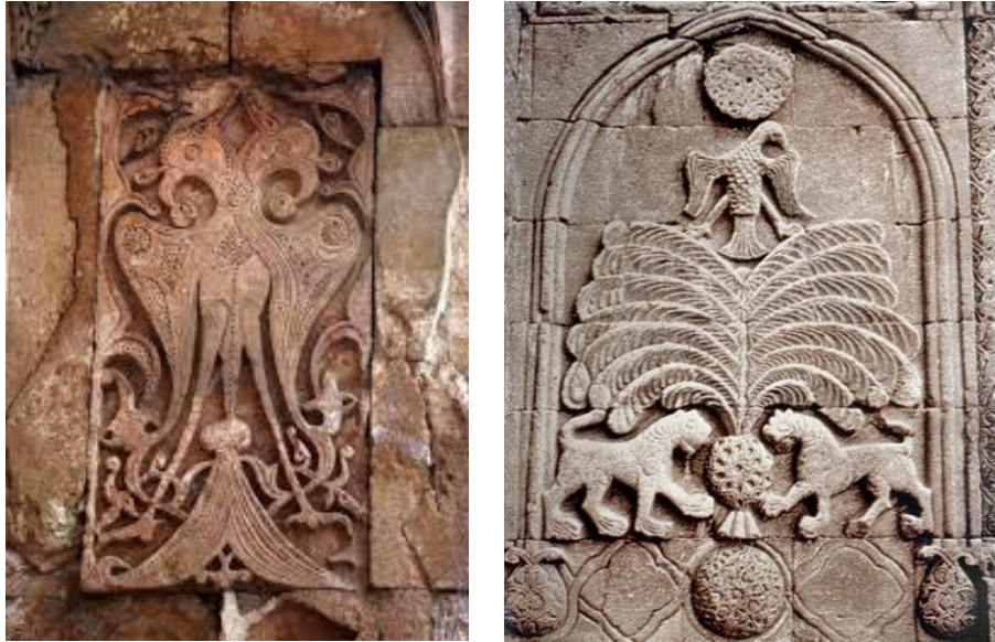
Resim 4-5: Divriği Ulu Camii ve Darüşşifası Çift Başlı Kartal ve Erzurum Yakutiye Medresesi (Özkul, 2019, s. 274-275).

Kuş figürlerine seramik ve çini eserlerinde de çokça rastlanıldığı gözlemlenmiştir. Özellikle Anadolu Selçuklu ve Osmanlı Döneminde çini ve seramiklerdeki kuş figürünün stilize edilmiş