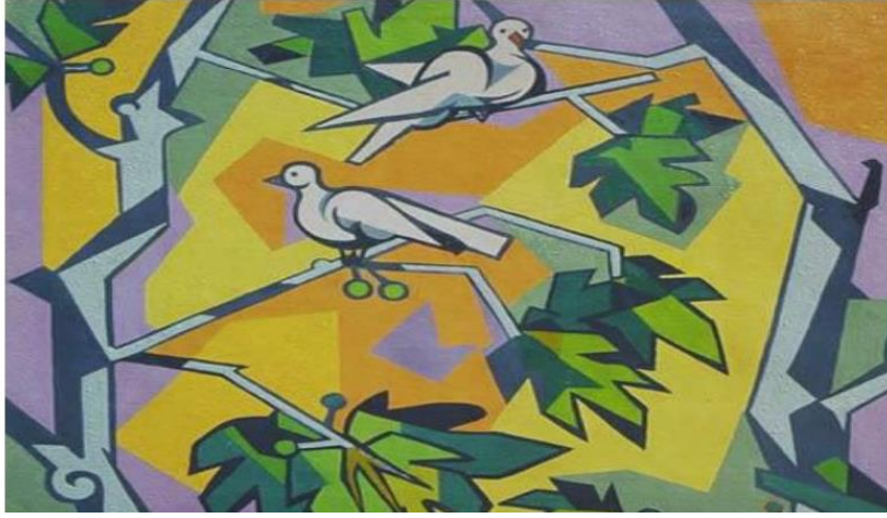
Resim 9: Nurullah Berk, Kuşlar.

Zaman içinde anlam değişikliğine uğrayan kuş imgesinin son süreçteki sanatsal anlam içeriğine bakıldığında özgürlüğün, hayvanseverliğin, toplumsal meselelerin, barışın, masumiyetin ve sevginin temsili olarak kullanıldığı gözlemlenmiştir. Cumhuriyet tarihinin eserleri incelendiğinde ünlü Türk ressam Nurullah Berk' in Kuşlar tablosunda (Resim 9), yine güvercin betimlemesi karşımıza çıkmaktadır. Geometrik-figüratif tarzın ilk örneklerinden olması açısından önemlidir. Kuş figürlerini ve tüm alanı geometrik parçalar ile çözümlediği yapıttaki belirgin konturların kullanımı sanatçının değişmeyen unsuru olarak dikkati çekmektedir. Toplumsal gerçekçi sanat akımının önemli ismi Nuri İyemin (Resim 10) kadın portresine eşlik eden beyaz güvercin imgesi de özgürlüğün temsidir denilebilir.