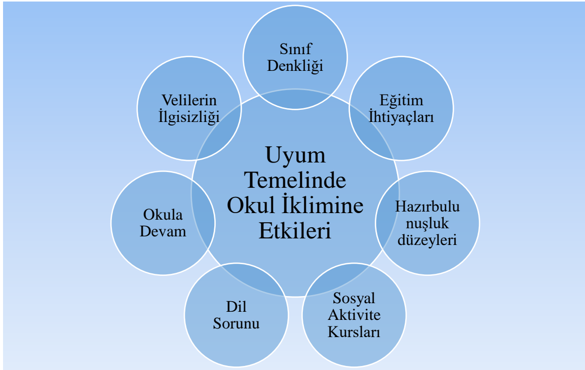
Şekil 1. Uyum Temelinde Okula İklimine Etkilere İlişkin Bulgular

Okul müdürlerinin görüşleri incelendiğinde “Uyum Temelinde Okula İklimine Etkileri” temasında;