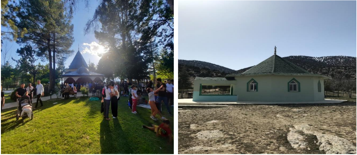
Fotoğraf 1. Abdal Musa Türbesi ve Budala Sultan Türbesi'nden görünüm

Budala Sultan Türbesi; külliye'nin en kutsal olan üçüncü avlusunda, Abdal Musa Türbesi'nin biraz uzağında dağın eteğinde yer almaktadır. Türbe görünüm olarak Abdal Musa Türbesi'ni andırmakla beraber, Abdal Musa Türbesi kadar gösterişli değildir. Abdal Musa Türbesi'nden sonra tekkenin en fazla korunan kısımlarından biridir ve hemen yanında "Kırklar Makamı" bulunmaktadır (Akçay, 1972).