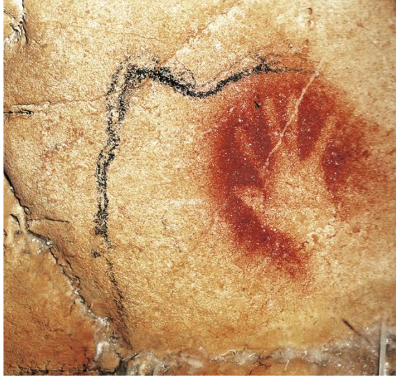
Resim 1: Chauvet Mağarası, Kırmızı el ve Mamut, M.Ö. 30.000

İlk yazı, bir anlayışa göre tek bir kaynaktan, bir yerde ve aynı zamanda, başka bir anlayışa göre de farklı yerleşik kültür bölgelerinde farklı zamanlarda ve farklı şekillerde ortaya çıkmıştır. Bu bölgelerden Mezopotamya kültür bölgesinde kerpiç tabletler, Mısır kültür bölgesinde papirüs, Uzakdoğu Asya ya da Çin kültür bölgesinde ahşap yüzeyler, yazının yaşatılması ve geleceğe aktarılması için kullanılan ilk yazı malzemeleri olmuştur. Zaman içinde yazıyı aktarma ve yazıyı biçimlendirme malzemeleri ağır bir değişim geçirmiştir (Sarıkavak, 2009: 3).