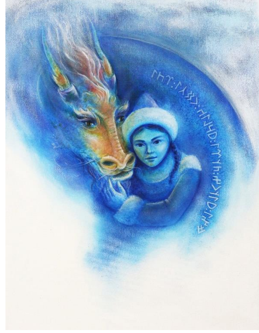
Resim 8: Eda UZUN, Balık ve Türk Kızı, 2016, Karışık Teknik Resim 9: Eda UZUN, Ejderha ve Türk Kızı 2016, Karışık Teknik

Eda Uzun tarafından Türk Runik alfabeti ile yapılmış bu tipografik uygulamalarda yazı karakterleri resmin bir elemanı olarak kullanılmaktadır. Resimlerde yazı karakterleri figürlerle etkileşim içerisindedir. Kullanılan yazılar konu ve içerik bakımından resmi desteklemektedir.