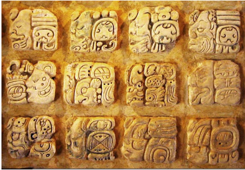
Resim 2: Maya Glif Örneği, Meksika Arkeoloji Müzesi, Palenque

Piktografik uygulamaların ilk örnekleri ise mağara resimleridir. Resim ya da semboller kullanılarak oluşturulan bu ilkel yazı sistemi, ilk çağlarda uzun yıllar boyunca kullanılmıştır. Piktografide simgeleştirilmiş bir anlatım biçimi vardır. Amaç anlatılmak istenileni sembolize ederek ifade etmektir. Örneğin bir piktogram bir cümlenin ya da olayın tamamını anlatabilir ya da insan vücudunu ifade eden bir sembol olarak kullanılabilir. Bu piktogramlarla yazılı metinler de oluşturulmuştur. Belli bir düzene sahip olmayan bu yazılar, soldan sağa ya da sağdan sola şeklinde yazılabiliyordu. Bunların bir tanesi olan Maya hiyeroglif yazısıdır. Piktografik kökenli olan ve ileri düzeyde stilize edilmiş simgelerin bir bölümü ise sese dayalıdır (Saygı, 2000: 10-12).