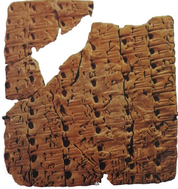
Resim 3: Uruk Tableti M.Ö. 4000