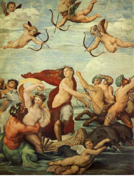
Şekil 4: Raffaello, Galatea'nın Zaferi, 1512, 295x224 cm (Farting, 2014:180)

mitolojisi antik dönem sanatlarını etkilediği gibi Rönesans, Barok ve Rokoko gibi ardından gelen birçok sanat akımını da etkilemiştir. 15. Yüzyıl ve sonrasında içeren bu zaman diliminde sıradan insanların aşklarından ziyade hala mitolojik tanrıların sıradışı aşk ilişkileri yansıtmıştır sanat tarihine. Rönesans'ın en ünlü ressamlarından biri olan Raffaello Sanzio da Yunan Mitolojisinden bir aşk öyküsünü Galatea (Şekil 4) isimli kompozisyonunda yorumlamıştır. Sanatçı konu olarak, Angelo Poliziano'nun yazdığı ve