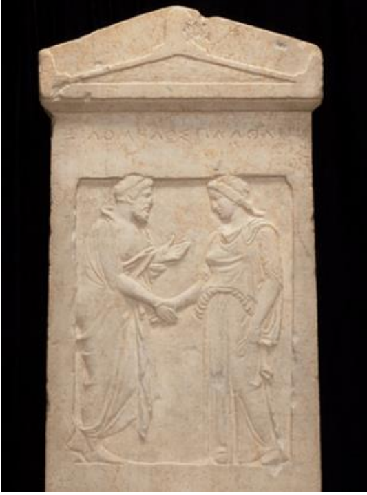
Şekil 1: Bir Çiftin Mezar Steli, MÖ. 5. Yüzyıl (Wells, 2021)

olarak gösterilebilir. “Evlilik içinde aşkın sanatta betimlendiği bir örnek, Philomelos ve Plathane'nin