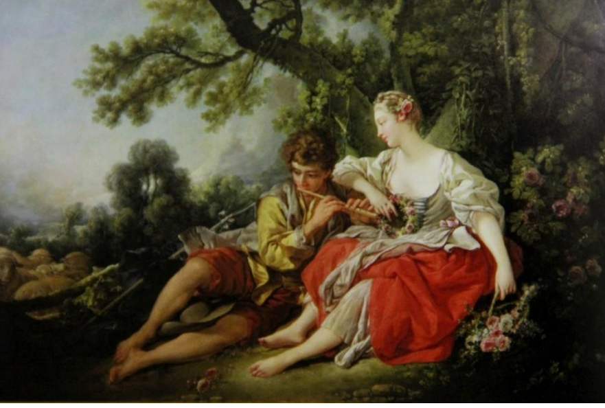
Şekil 8: François Boucher, Erkek Çoban Kadın Çobana Flüt Çalarken, 1747-50, 94x142 cm (Farting, 2014:250)