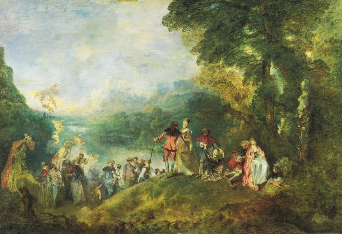
Şekil 5: Jean- Antoine Watteau, Kitera Adası'na Yolculuk, 1717, 129x194 cm (Farting, 2014:250)