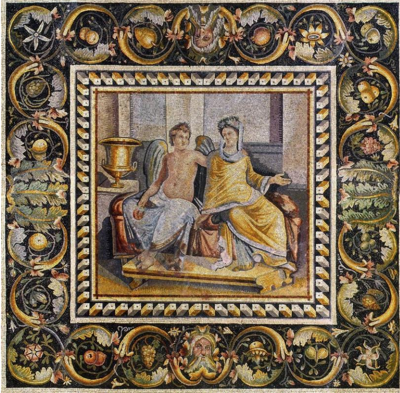
Şekil 3: Eros ile Psykhe Mozağı, M.S. II-III. Yüzyıl, Gaziantep Müzesi, (Ergeç, 2006: 140-141)

eziyeti yüzünden acılar çekmiştir. Araya Zeus'un girmesiyle Eros ve Psykhe barışıp kavuşmuşlardır (Ergeç, 2006: 136). Yunan mitolojisi bunlar gibi daha birçok aşk hikâyesini bünyesinde barındırır. Bu hikâyeler bazen bir dram olarak sona erer bazen de tıpkı Eros ve Psykhe gibi mutlu bir sonla biter. Yunan