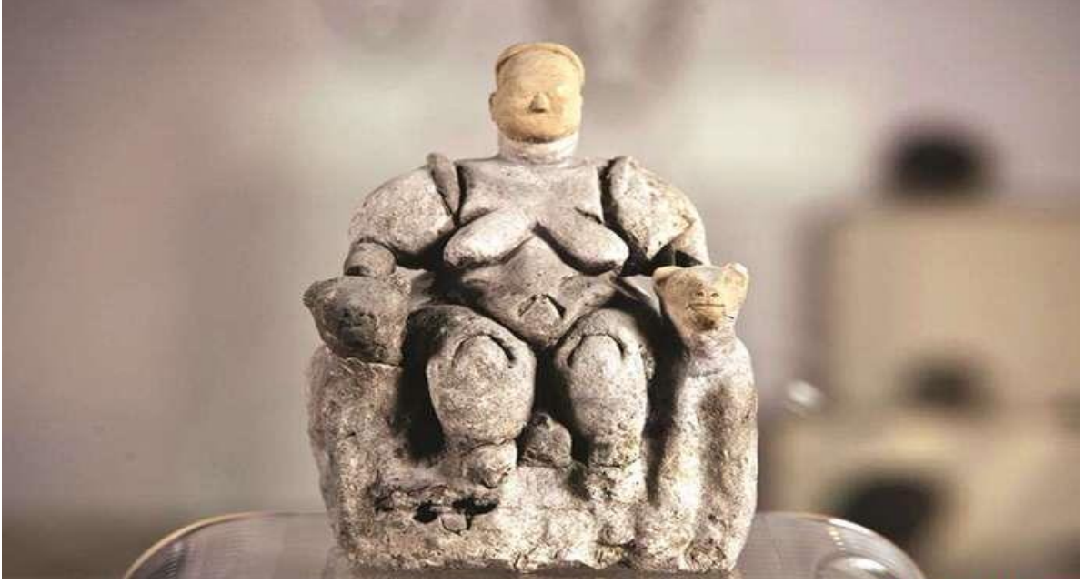
Görsel 4: (Anadolu'da İlk Yerleşimler, 2019)