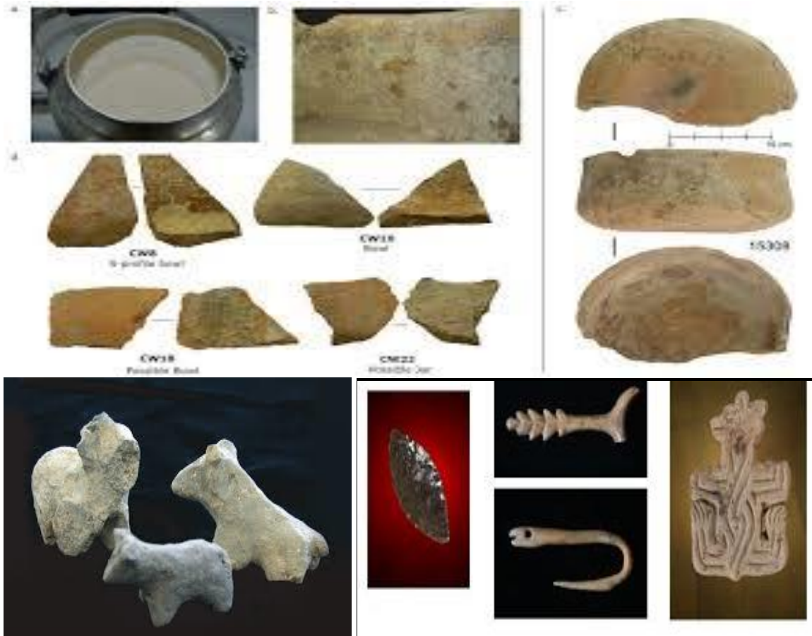
Görsel 5 : (Çatalhöyük Buluntuları ve El Sanatları, 2019)

Batı Höyük'te boncuk, figürin, işlenmiş kemik ve işlenmiş taş gibi küçük buluntulara da rastlanmıştır. Batı Höyük'teki evlerin içinde çoğu iyi korunmuş halde buluntularla karşılaşmış, bazı buluntular neredeyse tam veya sadece hafif bir zarar görmüştür. (Artun, 2016)