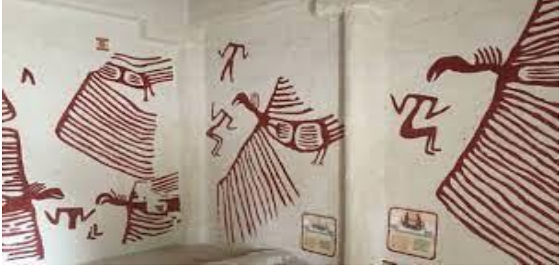
Görsel 3: (Hoddler, 2016)

(Hasan Dağı) aktif halde görülmesi dikkat çekmektedir. (Dünya Miras Listesinde bir Neolitik Kent) Tanrıçalar sıra kabartmalarda yalnızca antropomorfik olarak betimlenmiş, diğer taraftan erkek betimleri için, eril üreme gücünün çarpıcı simgesi olan boğalar ve koçlar kullanılmıştır (Mellaart, 2003).Başları vücutlarından koparılan cesetlerin duvar resimlerinde gösterilmesi bize ata kültü ile alakalı olabileceğini göstermişti fakat burada gebe bir kadının kabartmasının bulunması ve ana tanrıça heykelciklerinin çıkması da ana kültürünün olabileceğini gösteriyor. Belki de iki kültü de bir arada kullanmış ve önemsemiş olabilirler. (Mertek, 2018)